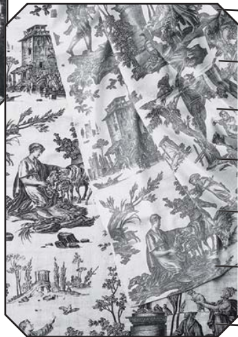
Toile de Jouy-en-Josas

Départ de la Place Sainte-Anne : 7 h précises.